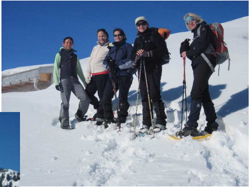
Lauter glückliche Gesichter !