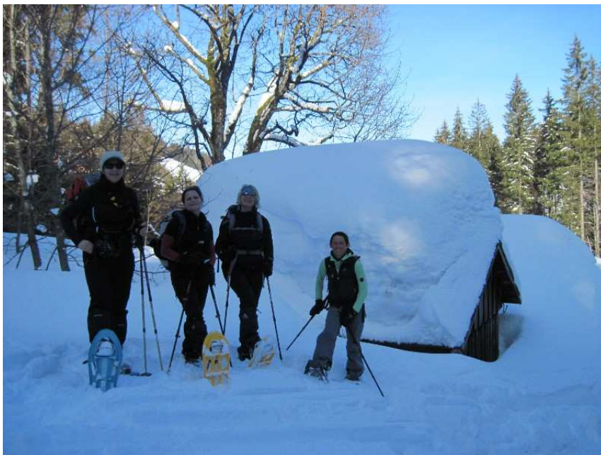
Ein schöner Tag geht zu Ende