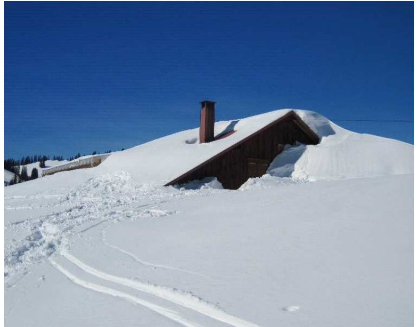
Tschüß Höllritzer- Alpe