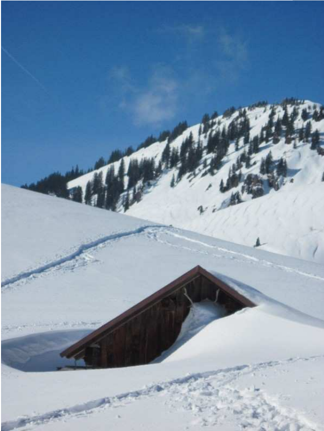
Das Hirschgeweih vom Nebengebäude als Schneefänger