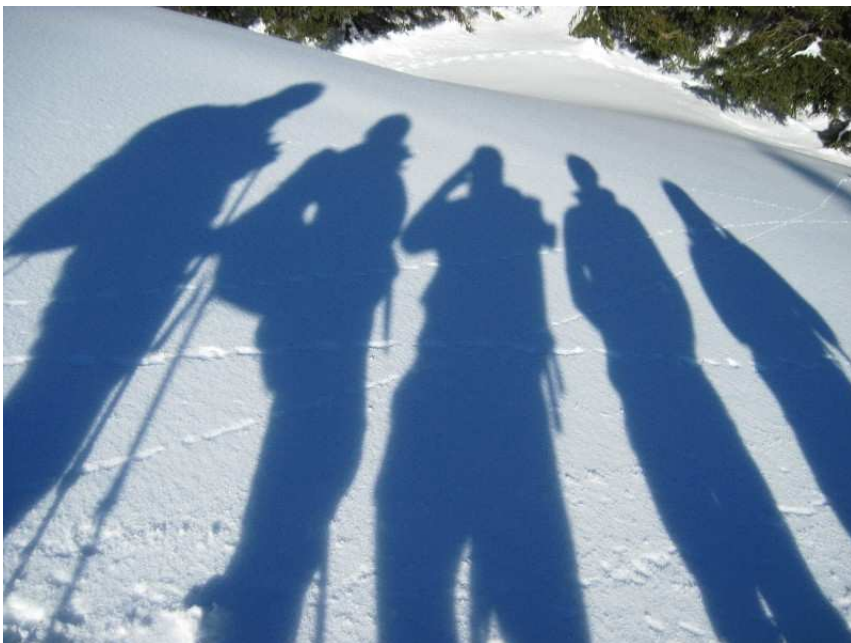
Suchbild . . .