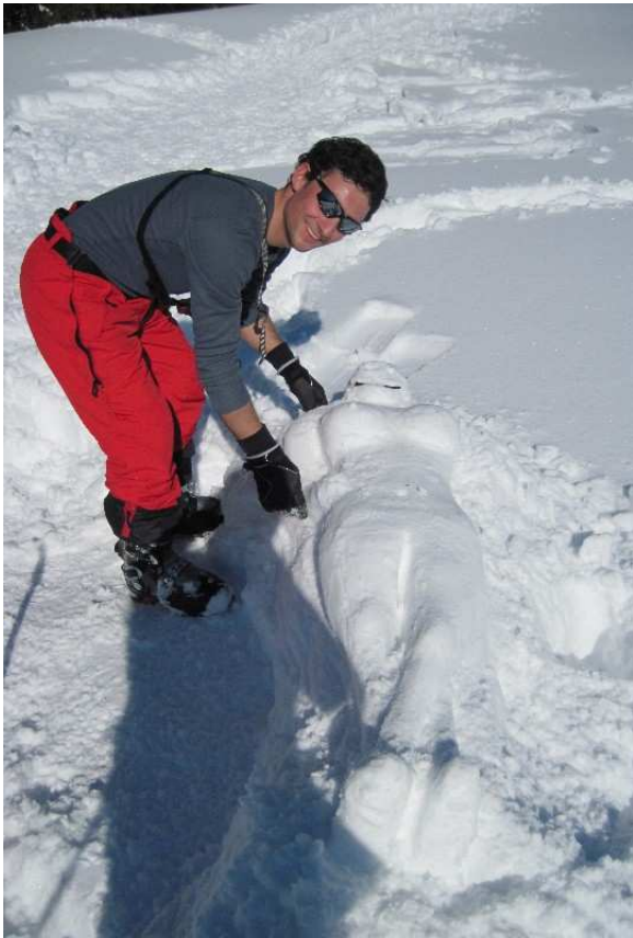
Spaß im Pappsnee. Ein Gruß an die Künstler ☺